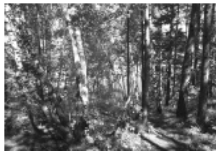
Там, на неведомых дорожках...

В походе наше время пролетело, как один миг. Надеемся, он был не последним. У всех остались хорошие воспоминания. Так интересно было в походе! А всем читателям советуем побывать на этой горе, послушать волшебное пение птиц, почувствовать запах травы, полюбоваться чудесной природой!