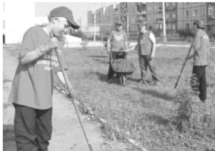
Кто ищет, тот всегда найдёт

Пожалуй, самый распространенный способ заработать. Достаточно просто обратиться в школу или в службу занятости, собрать нужные документы, оформиться и начать работу. Но мешкать с устройством здесь нельзя – количество мест ограничено. Зато плюсом в такой работе служит нормированный рабочий день (4 часа), постоянная зарплата и всего 14 рабочих смен. Также есть приятные бонусы: в школе это общение с друзьями, а в парке, например, катание на аттракционах в конце рабочего дня. Заработная плата около 3600 рублей.