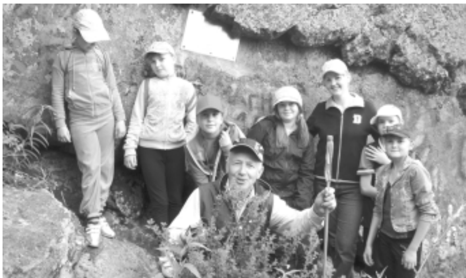
На высоте птичьего полёта

Мы, конечно, боялись, что кого-нибудь из нас укусит клещ, поэтому нас тщательно брызгали спреем.